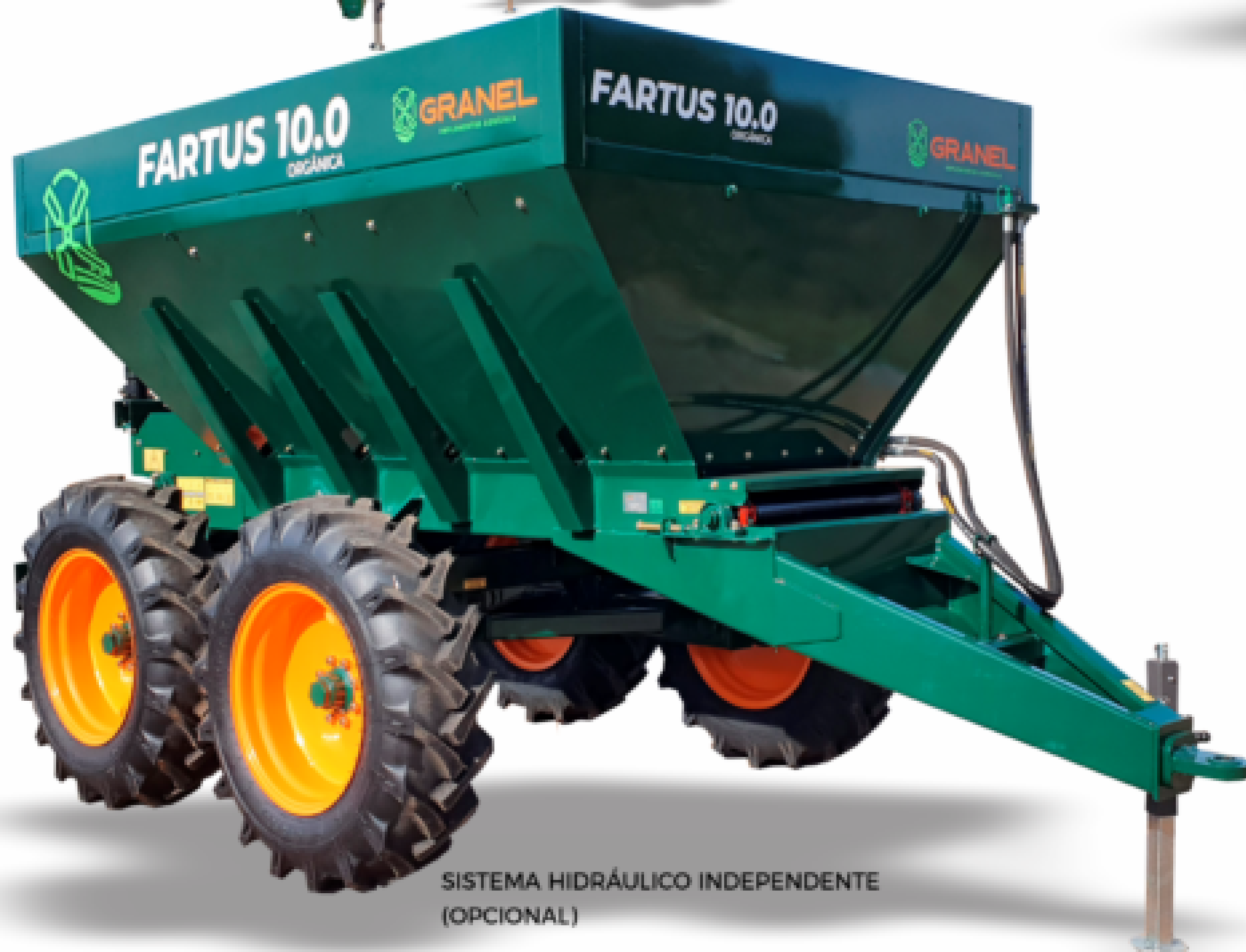
SISTEMA HIDRÁULICO INDEPENDENTE (OPCIONAL)